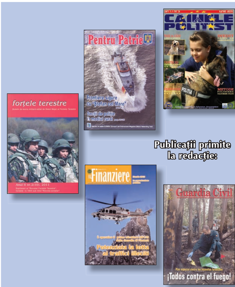
Publicații primite la redacție:

Cu ocazia Zilei Marinei Române, colectivul redacțional a editat și o ediție specială dedicată acestui eveniment, fiind surprinse festivitățile organizate la Constanța, dar și momente din istoria și prezentul Forțelor Navale Române.